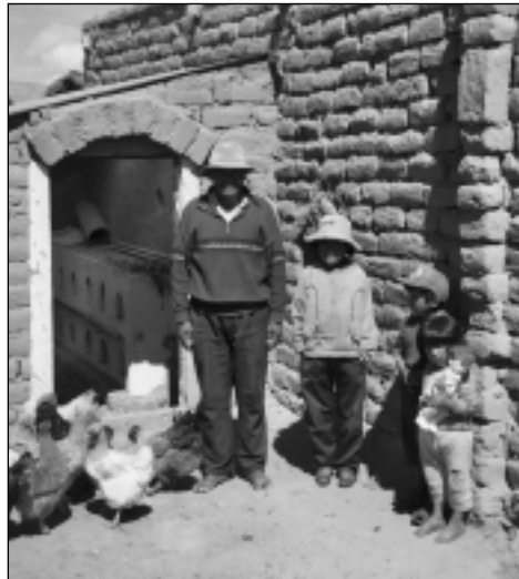
97% der ländlichen Bevölkerung lebt unterhalb der Armutsgrenze.