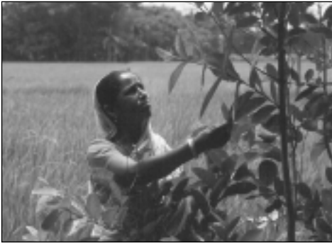
Traditionelle Obstbäume versorgen die Menschen mit einheimischen Früchten und tragen zu einer gesunden Ernährung bei.