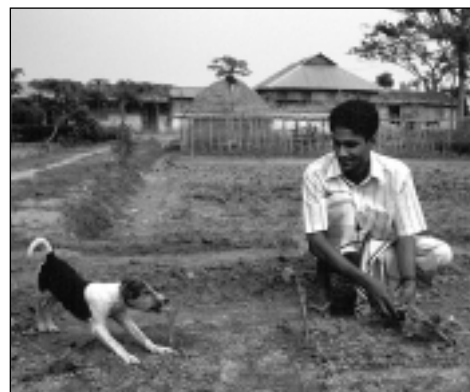
Im Netrakona-Distrikt, ca. 200 km von der Hauptstadt Dhaka entfernt, unterstützen die Quäker arme Kleinbauern-Familien mit einem ökologischen Landwirtschafts-Projekt.

Durch jahrelangen umweltschädigenden Anbau von Monokulturen ist in diesem Gebiet die Nahrungsqualität erheblich gesunken. Durch den ausschließlich auf Reis ausgerichteten Anbau fehlen den Menschen wichtige Mineralstoffe und Vitamine, die in einheimischem Obst und Gemüse enthalten wären.