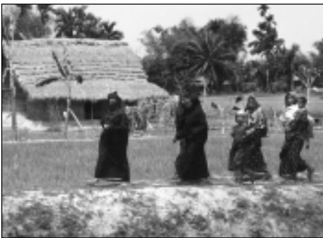
Frauen auf dem Weg zur Schulung: Denn Saaterhaltung ist in Bangladesh traditionell Frauensache.

Gleichzeitig werden auf der Modellfarm Frauen im Umgang mit Kleinkrediten ausgebildet und Spazirkel eingerichtet, um Kühe, Enten, Ziegen oder Hühner zu kaufen. Auf der Farm lernen sie die richtige Pflege ihrer Tiere und auch die Vermarktung der Produkte. Durch den Verkauf von Eiern, Milch und Jungtieren sind sie dann in der Lage, ihren Kredit zurückzuzahlen.