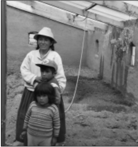
Durch Gewächshäuser verbessert sich die Lebensqualität der Familien.

Material, Lüftung, Tageslichteinfall, Sonnenbestrahlung: Alles ist auf ein ertragreiches Wachstum der Pflanzen abgestimmt. Ausgebildete Fachkräfte vor Ort betreuen und beraten die Kleinbauern in allen technischen und landwirtschaftlichen Fragen.